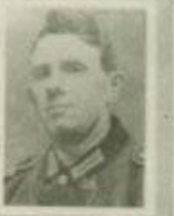
Sold. F. Schweggenberg gef. am 21.04.42