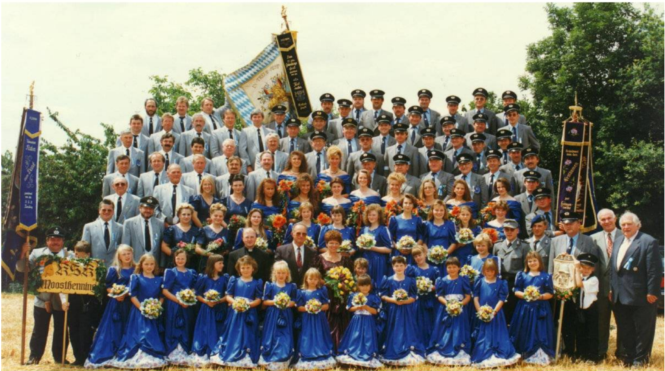
Jubelverein mit Patenverein KSK Moosthenning 1996