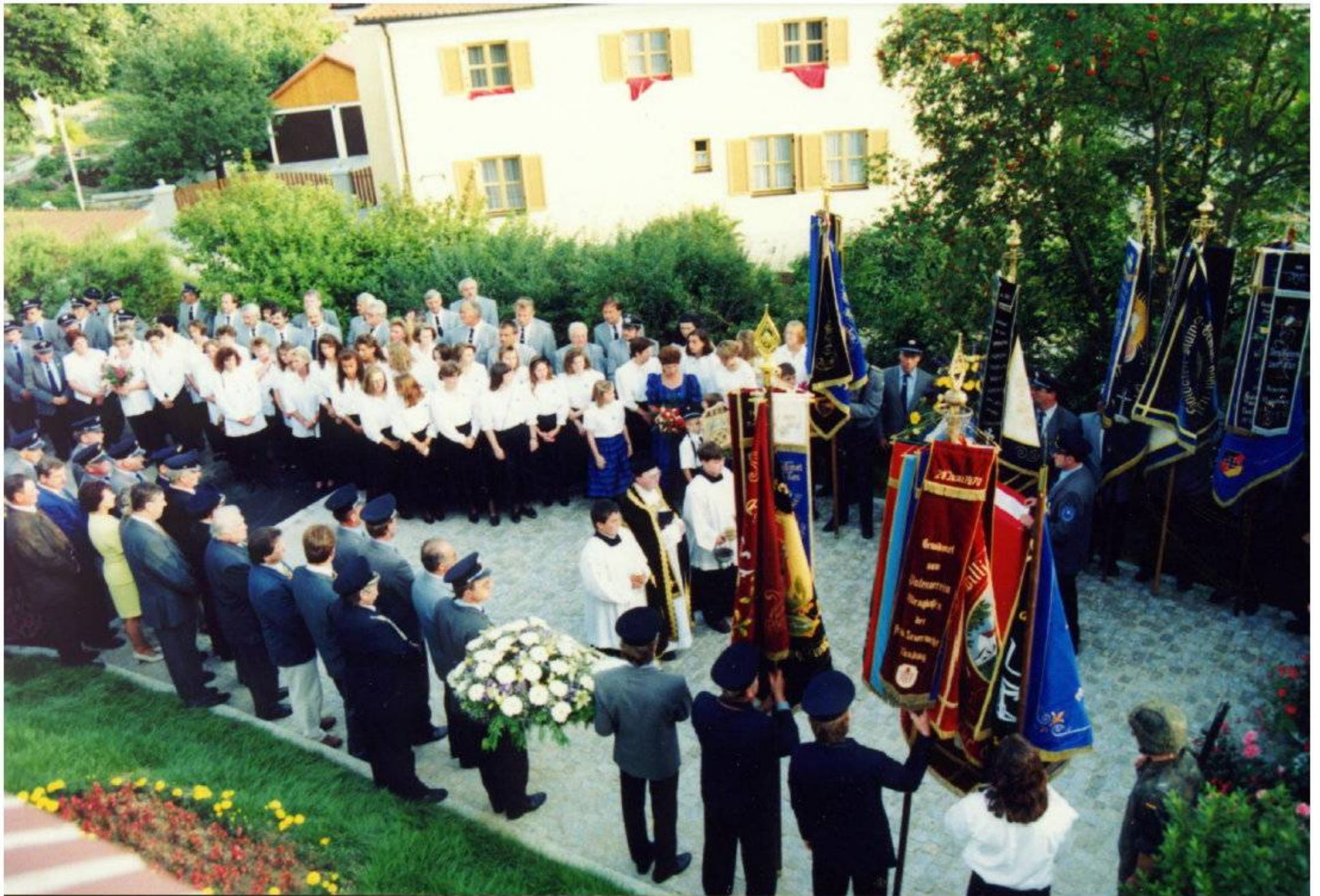
20.07.1996 Einweihung des Kriegerdenkmals und Gedenken