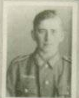
Sold. J. Brunbauer gef. am 01.03.45