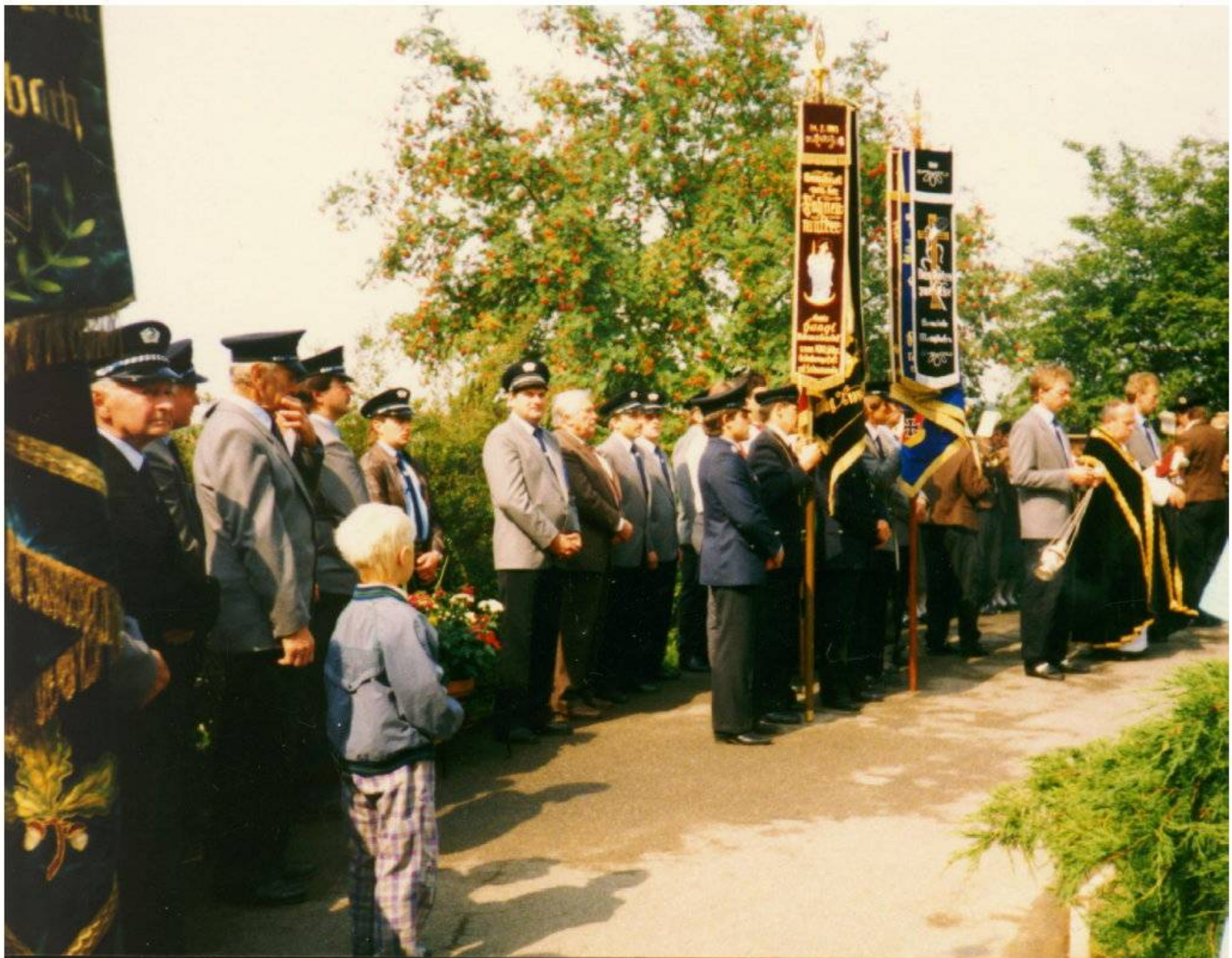
Gedenken am Kriegerdenkmal, Jahresfest, 1993