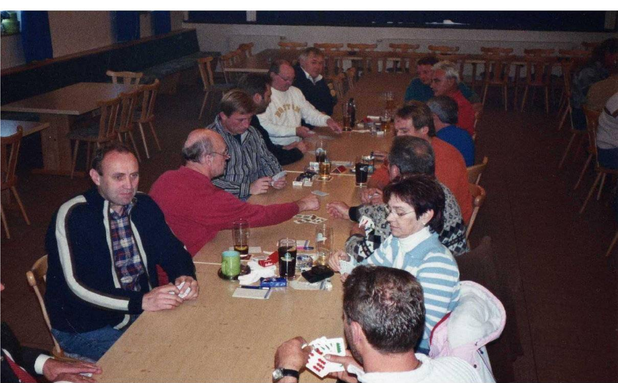
Vergleichswatten mit Patenverein KRK Mengkofen