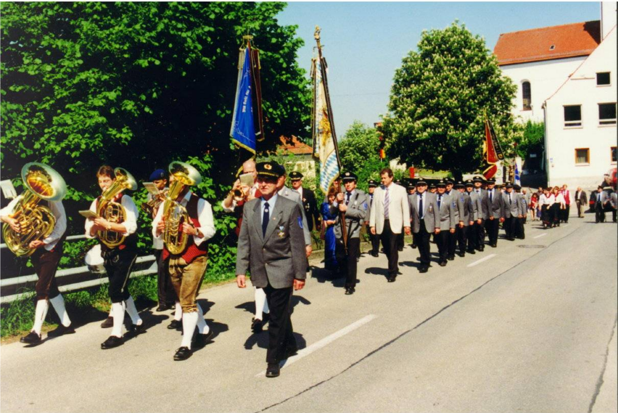
Festzug Jahresfest, 1999