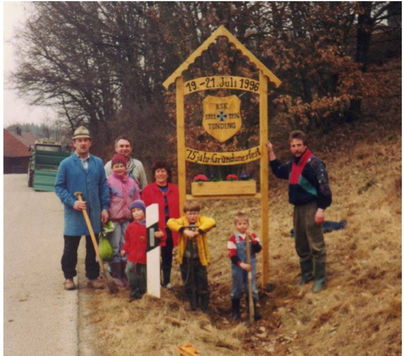
Begrüssungstafel zum 75zig jährigen Gründungsfest