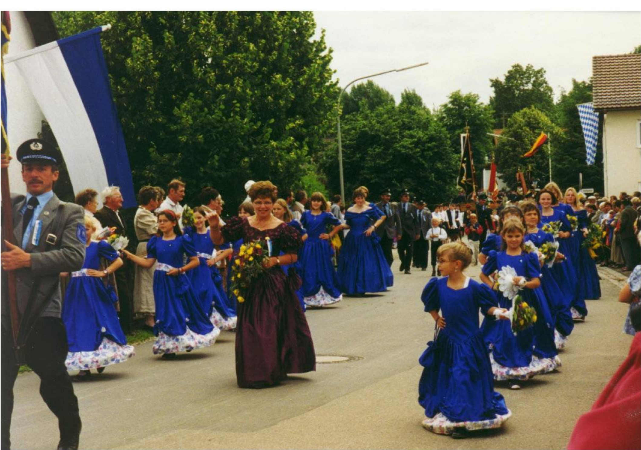
KSK Tunding bei der Fahnenweihe des Trachtenverein Hofdorf