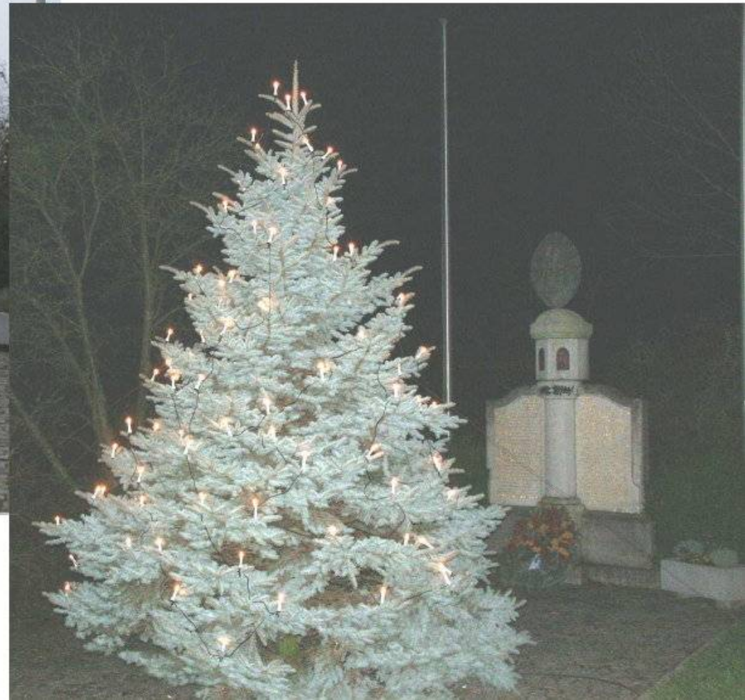
Christbaum am Kriegerdenkmal