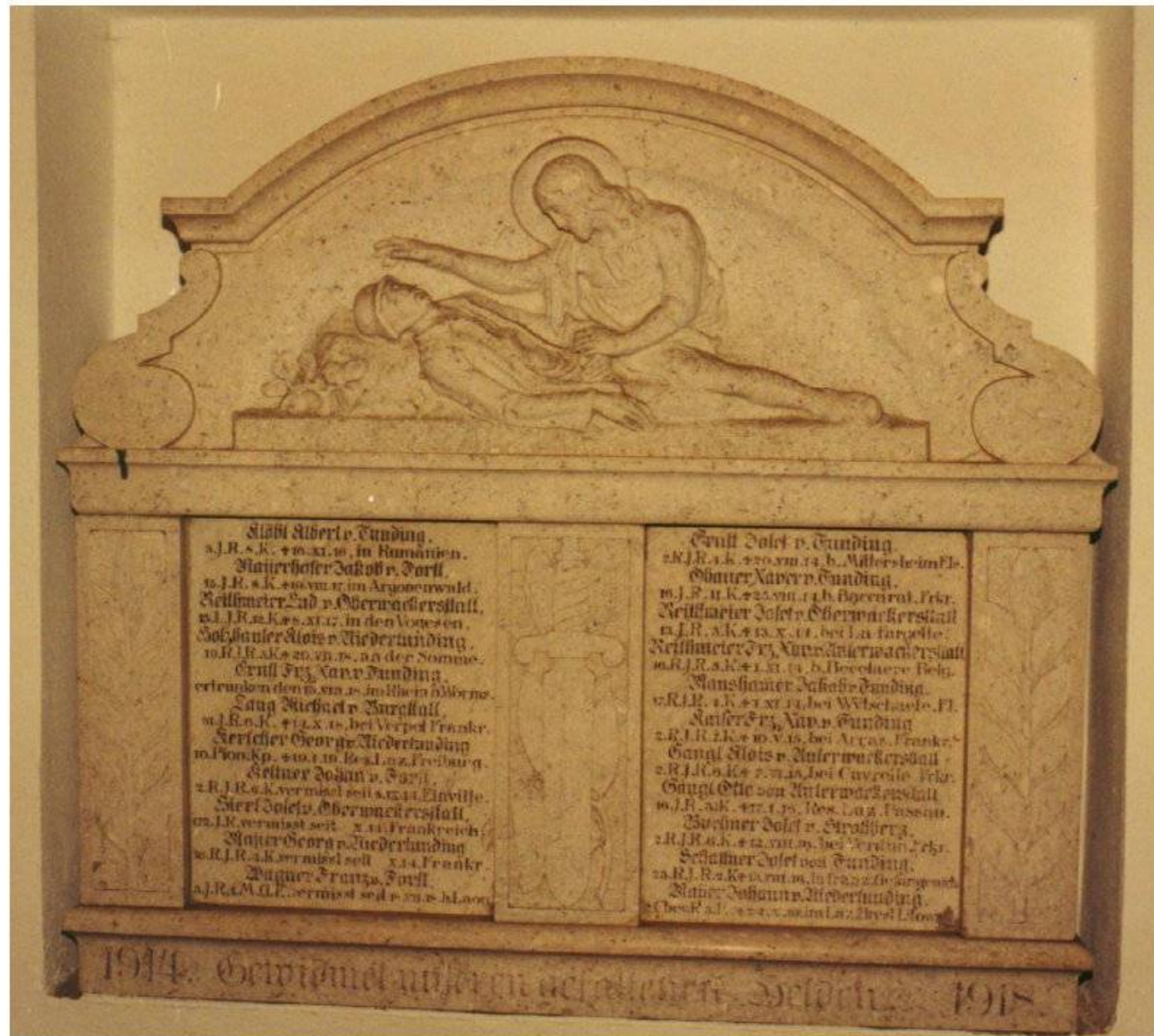
Gedenktafel für die Gefallenen 1914 – 18 (im Portal der Tundinger Kirche St. Katharina zu sehen)