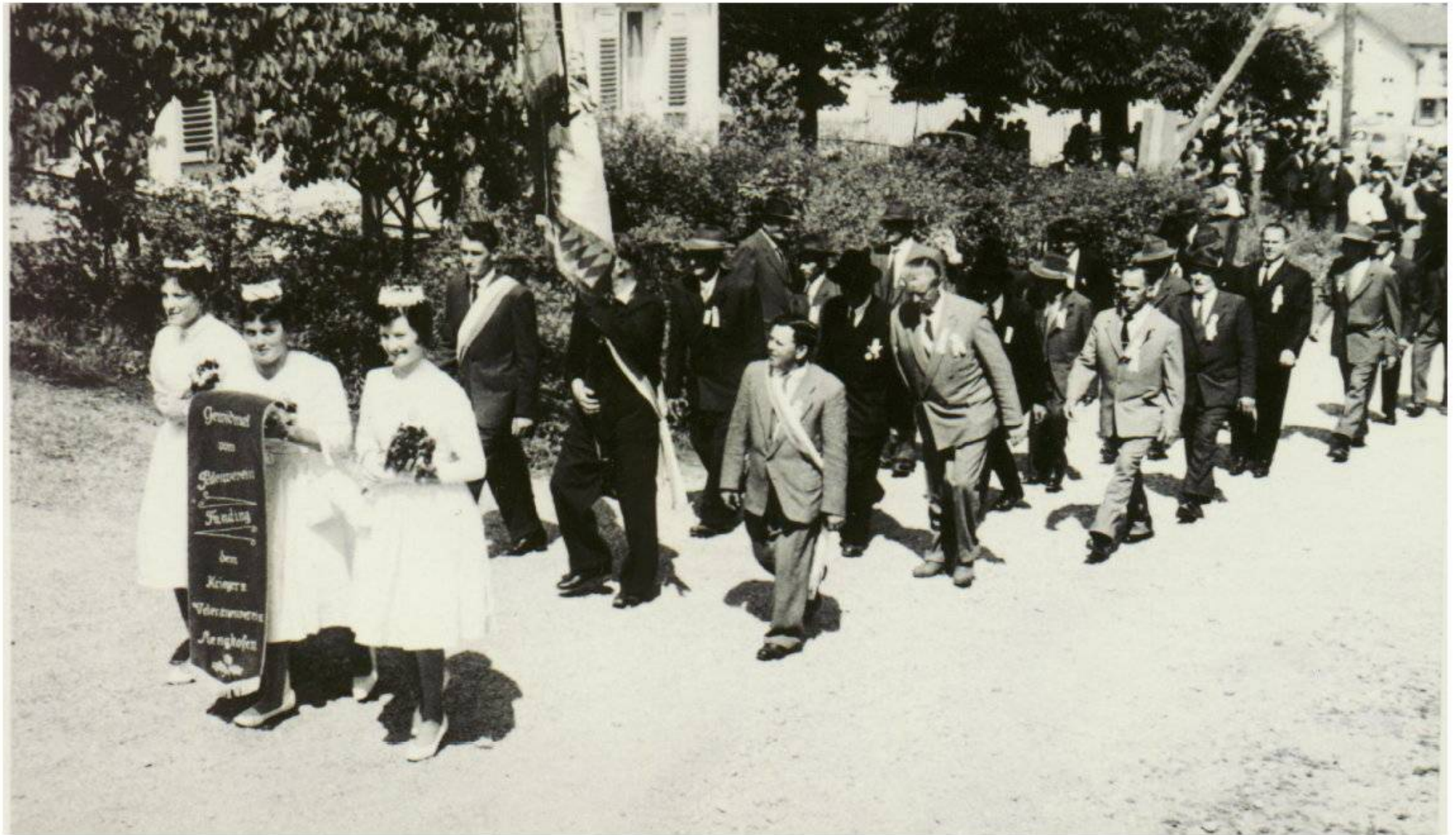
18.06.1961 Fahnenweihe KSK Mengkofen