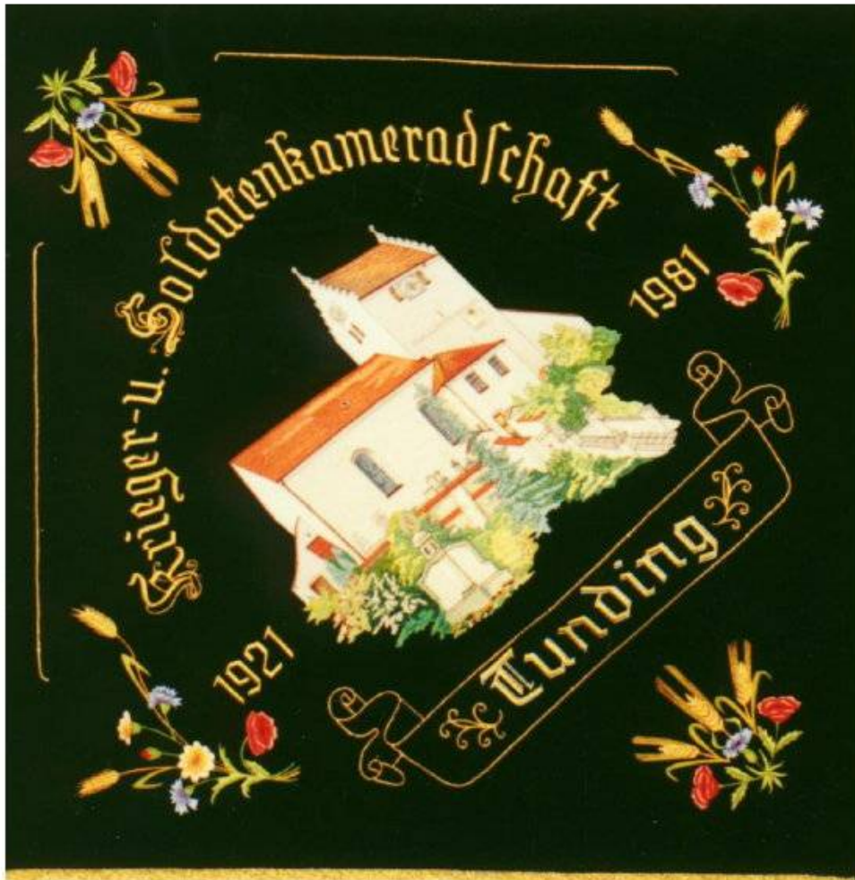
Vereinsfahne 1981 60 jährigen Gründungsfest 10. - 12. Juli 1981