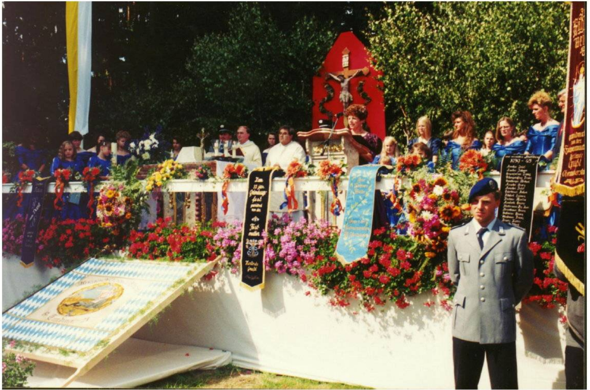
21.07.1996 Weihe der restaurierten Gründungsfahne von 1921