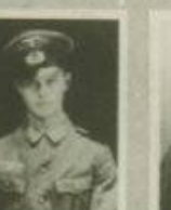
Sold. J. Esterbauer gef. am 17.02.43