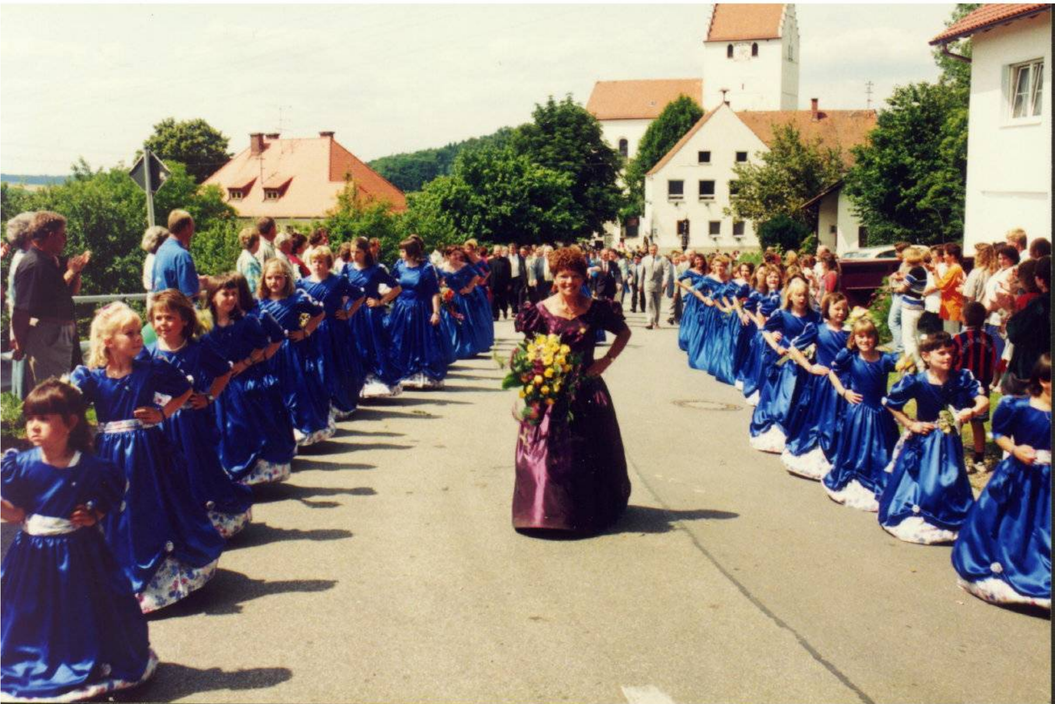
Festzug 1996 durch Tunding